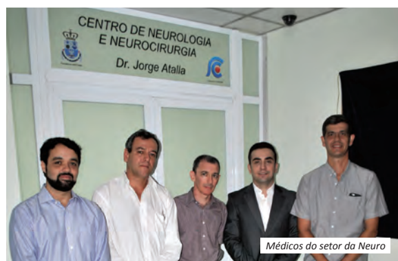
Médicos do setor da Neuro