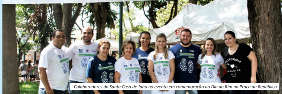
Colaboradores da Santa Casa de Jahu no evento em comemoração ao Dia do Rim na Praça da República

A Santa Casa de Jahu realizou no sábado dia 11 de março na Praça da República (Jardim de Baixo), aproximadamente 500 atendimentos gratuitos em comemoração ao Dia Mundial do Rim. Na ocasião, foram feitos testes gratuitos de glicemia, aferição de pressão arterial, exames de urina I e índice de massa corporal. Essa ação foi resultado da parceria entre Santa Casa e Secretaria Municipal de Saúde de Jaú, Sesi, Etec, Faculdades Integradas de Jaú e Laboratório Miotto.