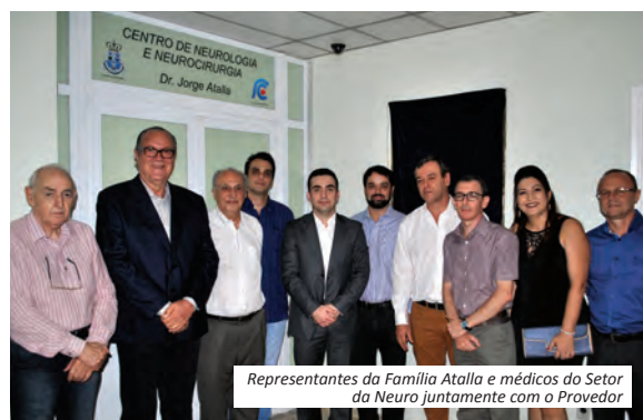
Representantes da Família Atalla e médicos do Setor da Neuro juntamente com o Provedor