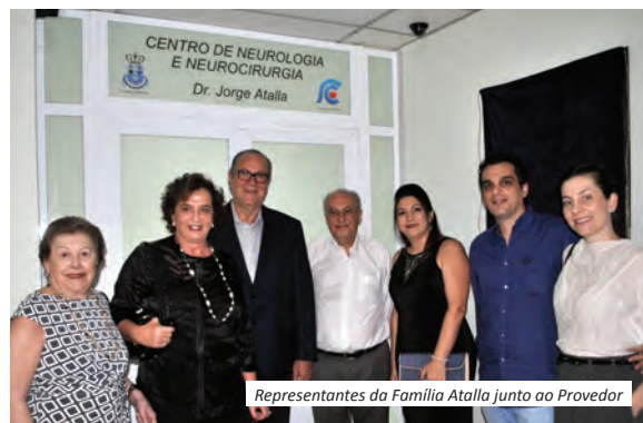
Representantes da Família Atalla junto ao Provedor

As doenças do sistema nervoso central e periférico, são uma das mais desafiadoras na área da medicina e a equipe de neurocirurgiões e neurologistas da Santa Casa de Jahu oferecem atendimento e suporte qualificado. Esta nova unidade viabilizará maior eficácia nestes cuidados.