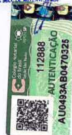
Foto emitida através Cartão de Escritório VALIDA JUNTAMENTE COM SELLO DE AUTENTICAÇÃO